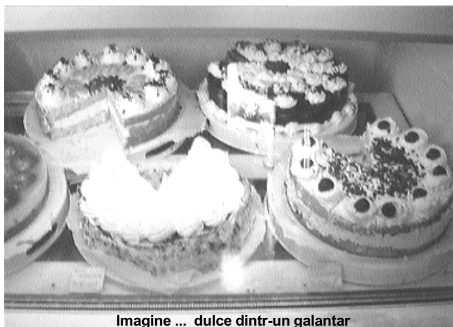
Imagine ... dulce dintr-un galantar