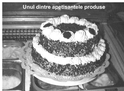
Unul dintre apetisantele produse

există și în bine și în rău. Desigur puterea de cumpărare a românilor este scăzută, de aceea de multe ori oferta noastră nu este atât de generoasă precum am dori-o noi și cum este în străinătate. Atutul nostru, recunoscut și de străinii care ne-au vizitat, este gustul