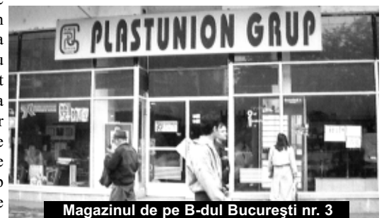
Magazinul de pe B-dul București nr. 3