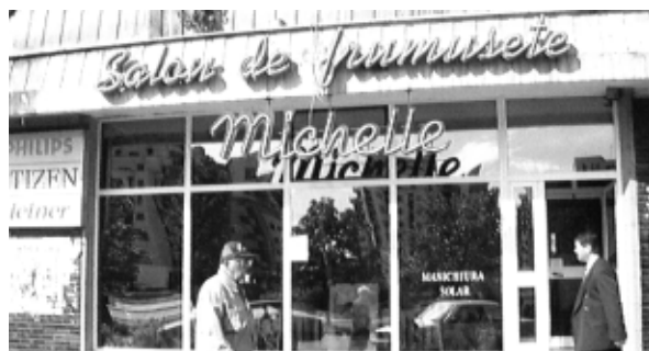
Salonul de frumusețe Michelle

POPA – șef contabil, dovadă fiind profitul înregistrat în 1997 de 385.771 mii lei. „Cifra de afaceri a unității în 1997 a fost de 1.080.981 mii lei – ne declară d-na Popa, în timp ce totalul veniturilor s-a ridicat la 1.816.780 mii lei.”