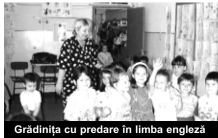
Grădinița cu predare în limba engleză

Pe 30 aprilie a.c., s-au făcut alegerile consiliului de administrație al SOCOM „PROGRESUL”, ce au loc periodic din 5 în 5