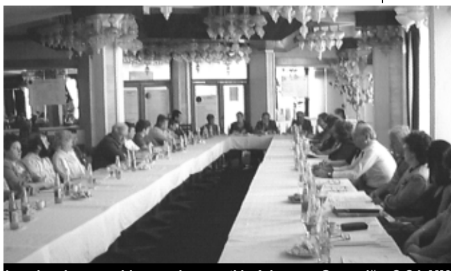
Imagine de ansamblu cu cei prezenți la Adunarea Generală a C.C.I. MM

caracter general (RIVULUS DOMINARUM), la care au participat peste 100 de expozați din țară, județ și străinătate; □ organizarea primelor acțiuni de parteneriat economic și comercial, cu ocazia desfășurării manifestării expoziționale, acțiuni ce au reunit peste 300 de firme din județ, țară și străinătate; □ antrenarea pentru prima dată a elevilor din liceele de specialitate (telecomunicații, muzică și auto) precum și a studenților, în organizarea și popularizarea manifestărilor expoziționale; □ asigurarea facilităților și gratuităților la participarea la târguri și expoziții pentru membri CCI – societăți comerciale și respectiv Asociații Familiale și Persoane Fizice; □ realizarea paginilor publicitare WEB, a catalogelor și pliantelor publicitare color,