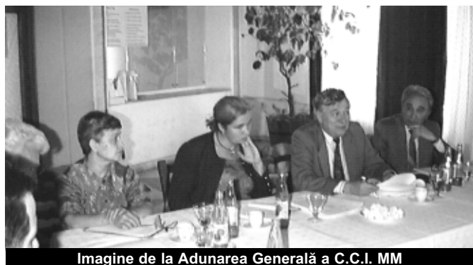
Imagine de la Adunarea Generală a C.C.I. MM