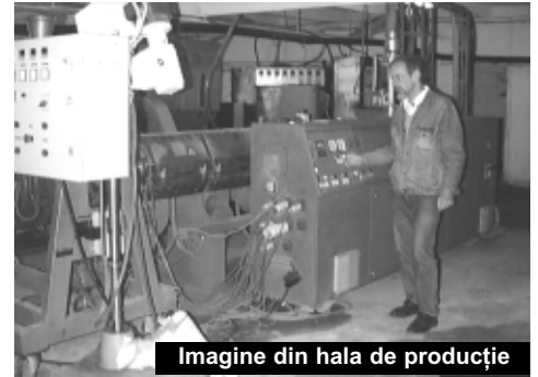
Imagine din hala de producție

Studii de fezabilitate și necesitățile din infrastructura actuală au îndreptat atenția managerilor către producția de avioane tip sport de