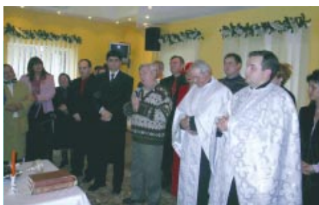
Aspecte de la ceremonia de inaugurare a pârției de schi a Complexului "Turist Șuior"

"Maramureșul este forma cea mai pură a geniului creator românesc. Fiecare colț este ca un glas care așteaptă o ureche. O călătorie aici este un prilej continuu de freamăt, de oprire, de exclamare."