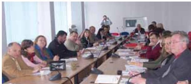
Familiei și Protecției Sociale și Ministerul Educației, Cercetării și Tineretului.

➤ Curs de inițiere Agent Imobiliar – începând cu 02 februarie 2009