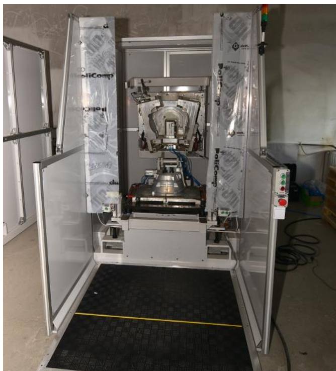
Cabină de injecție spumă poliuretanică cu dispozitiv tool-carrier

Este utilizată pentru obținerea prin injecția de spumă poliuretanică în matrice, urmată de un proces de coacere prin care spuma se solidifică, a unor piese diverse. Beneficiarii pot fi companii specializate în procesarea cauciucului și poliuretanului pentru realizarea unor repere destinate echipării autovehiculelor